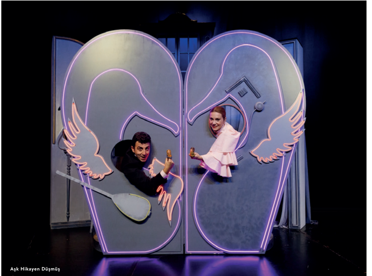
Aşk Hikayen Düşmüş

İzmir CityFest'23 / 22 Ekim 2023 / İzmir Arena